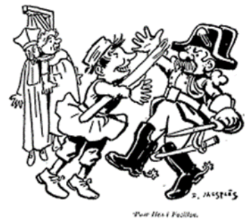
GUIGNOL & LA CABARETIÈRE

- Le spectacle de Noël aura lieu la 1ère semaine des vacances scolaires